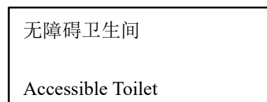
图 1 “无障碍卫生间”标志 1